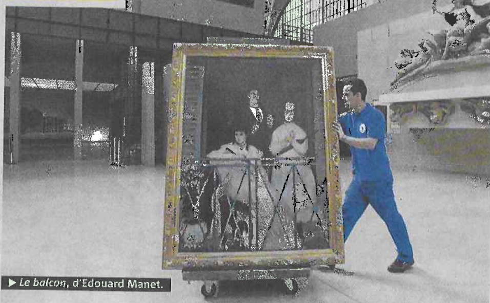
► Le balcon, d'Edouard Manet.