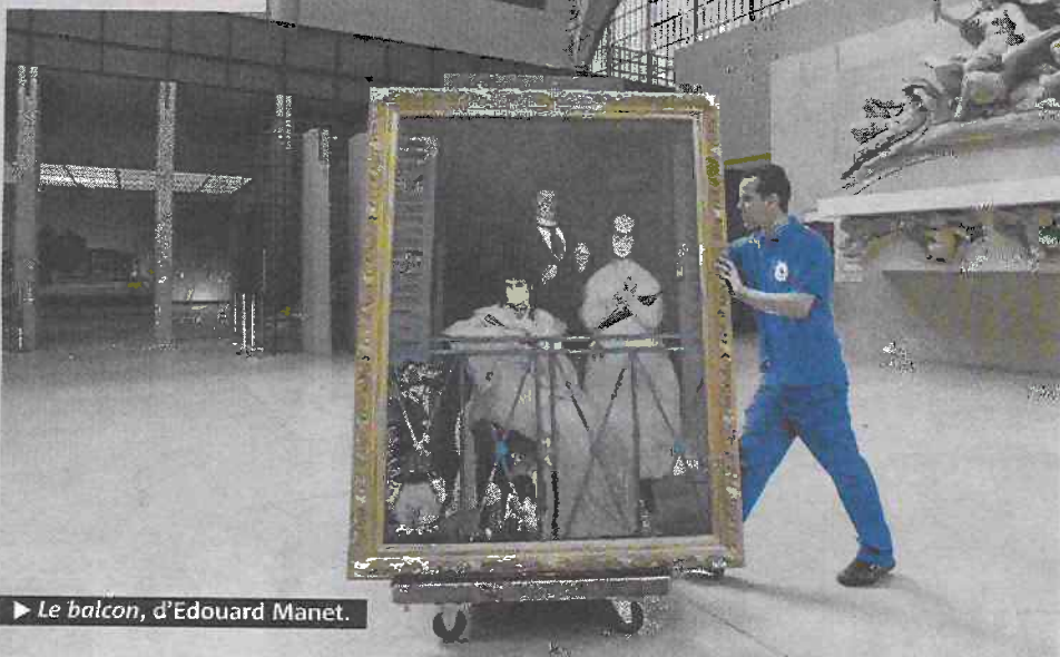
► Le balcon, d'Edouard Manet.