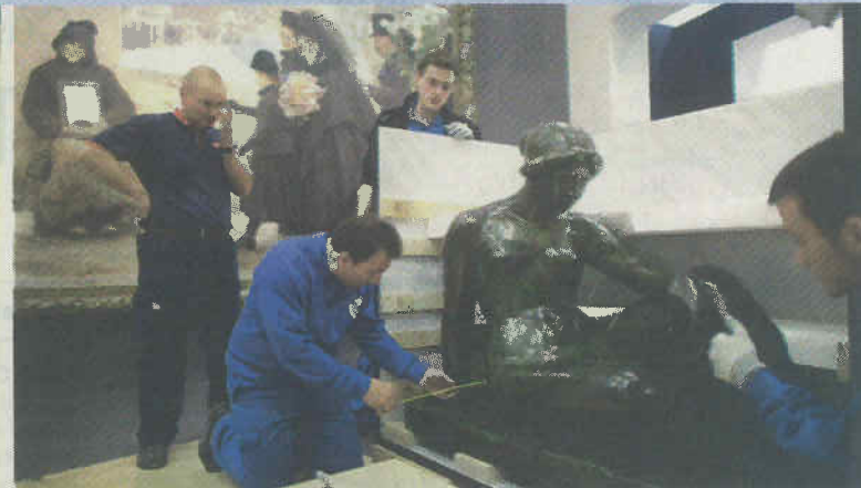
Les derniers préparatifs pour l'installation d'une statue de Maillol. A gauche, deux œuvres du peintre et sculpteur Joan Miró, Bleu 1 et Bleu 2 .