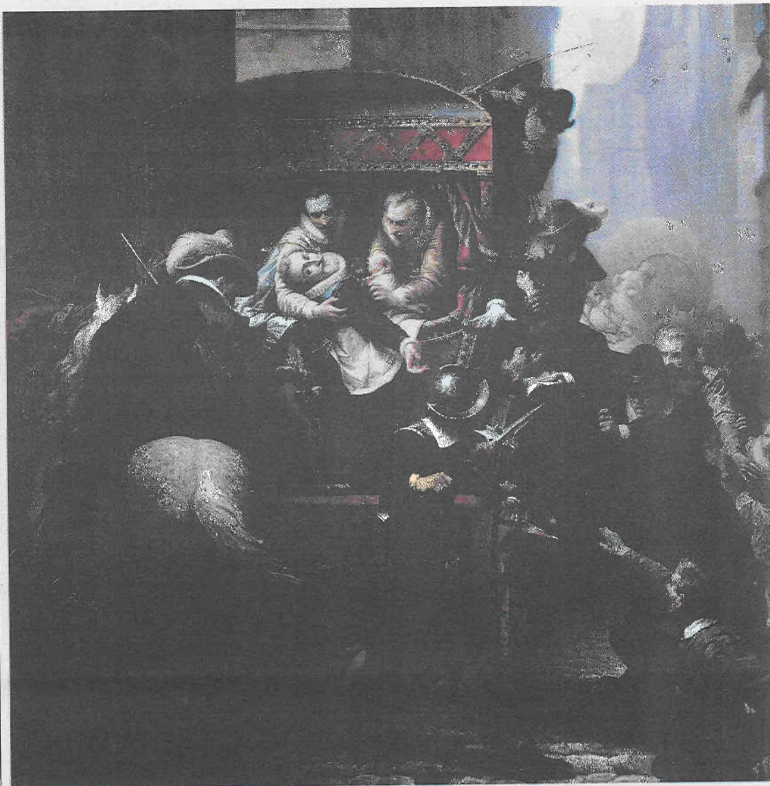
L'exposition reflète le regard de plusieurs artistes sur le régicide.