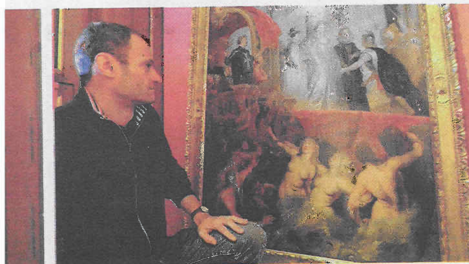
Chaque tableau retrace un fait marquant de la vie du Roi.