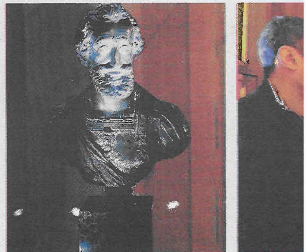
Un buste du Roi.