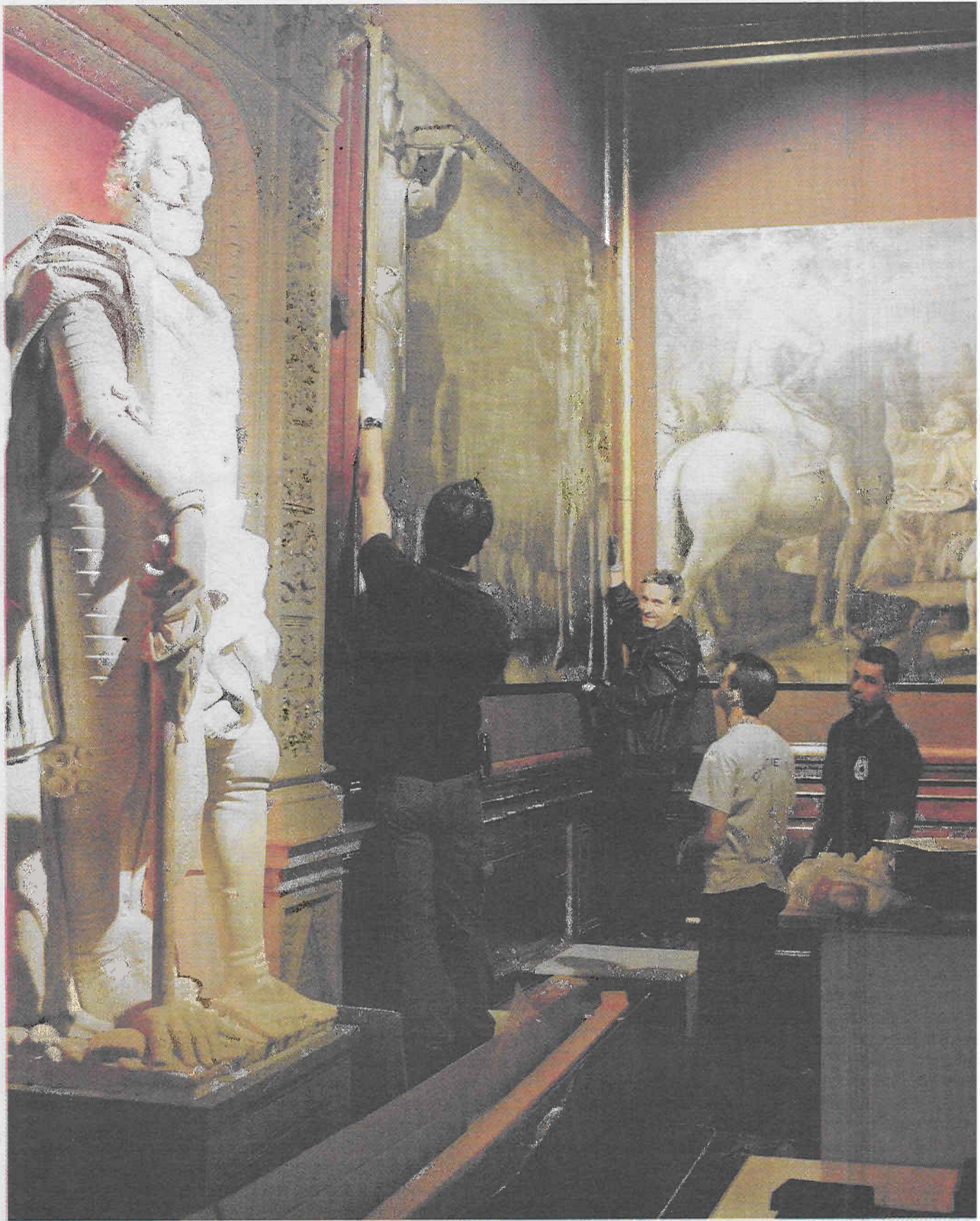
Agées de quatre siècles, les temperas sur toile ne supportent pas un éclairage cru. Elles sont mises en scène avec une lumière tamisée.

(1) Environ vingt artistes travaillant habituellement pour les Médicis, principalement Jacopo da Empoli, Bernardino Poccetti, Francesco Curradi et Matteo Rosselli, ont été sollicités pour peindre ces tableaux.