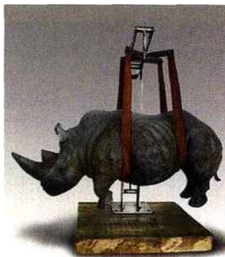
Stefano Bombardieri (né en 1968), Le Poids du temps suspendu , 2010, bronze, structure en fer, bois et lanieres de cuir, 85 x 55 x 80 cm, édition de 8, galerie Ferrero, du 2 décembre 2010 au 20 janvier 2011.

Étoile montante de la nouvelle sculpture italienne, Bombardieri a participé à la 52 e Biennale de Venise. Ses œuvres, oscillant entre hyperréalisme et surréalisme, invitent à une certaine réflexion philosophique. Que ce soit son redoutable rhinocéros, référence dalinienne, immobilisé impuissant dans l'air, comme sa Vanité , constituée de pneus usagés, symbole de notre société de consommation agonisante, ou encore son Sumo , immortalisé en train de pousser désespérément un mur invisible, l'œuvre de Bombardieri évoque le temps et sa perception, mais aussi la douleur et la mort.