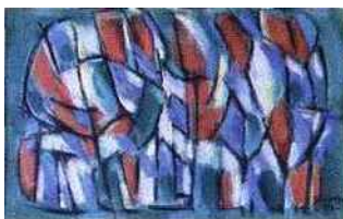
Jean Le Moal (1909-2007), Impressions d'été, 1956, huile sur toile, galerie Chauvy, Paris IX e, du 2 au 20 décembre.