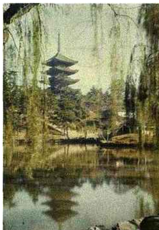
La Pagode à cinq étages du temple Kofukuy, Nara , 1926, autochrome de Roger Dumas, inv. A 56 664. © Musée Albert-Kahn - Département des Hauts-de-Seine

L'exposition met en valeur l'un des fleurons du patrimoine départemental : les collections d'images conservées au musée Albert-Kahn. Les opérateurs du banquier ont voyagé au Japon lors de périodes charnières correspondant à trois règnes impériaux, les ères Meiji, Taishō et Shōwa : une époque où le pays est en pleine mutation sans que disparaissent pour autant un patrimoine culturel désormais atemporel. La modernité du Japon de ce début du XX e siècle sera mise en avant dans une seconde exposition au musée bouloonnais.