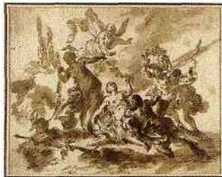
Gaspare Diziani (1689-1767), Allegorie du printemps, plume, encre brune et lavis brun, 23 x 30 cm, galerie Artesepia, 40, rue de Verneuil, Paris VII e, le 2 décembre 2010.

en proposant aux amateurs des objets sélectionnés avec passion et rigueur. Archéologie, céramiques, tableaux, dessins, textiles, sculptures, mobilier XVIII e , XIX e ou XX e siècle : les marchands ont choisi des œuvres à la fois originales et répondant aux critères d'exigence des collectionneurs.